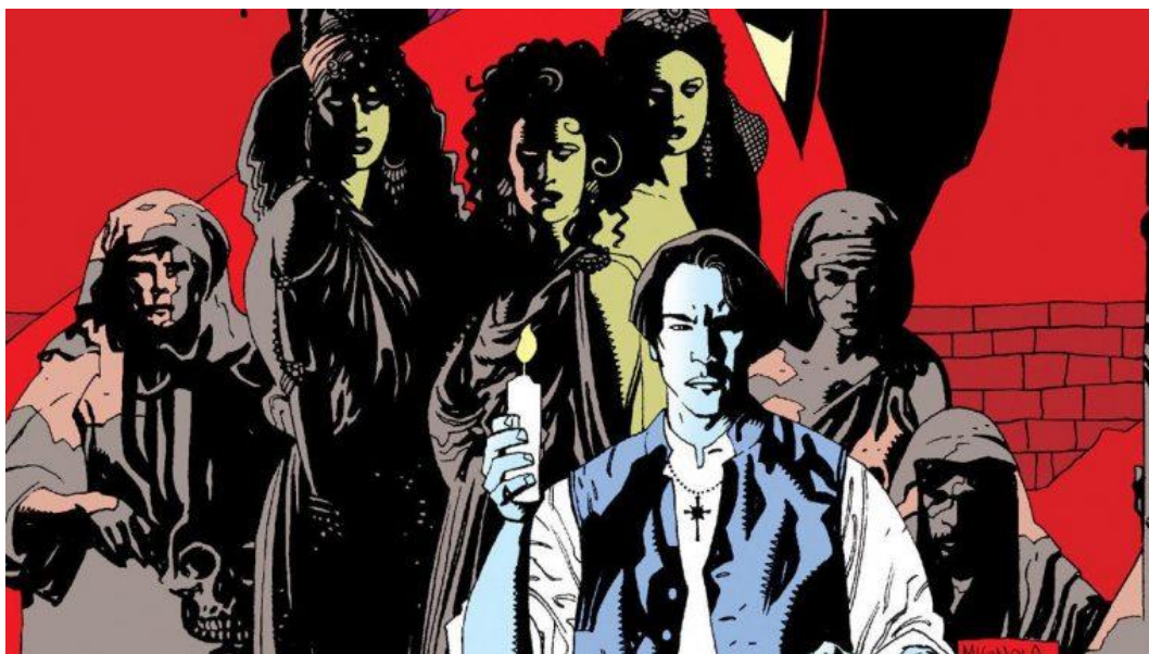
Crédito: Mike Mignola

3) Complete o texto que segue com o nome do autor e de um romance brilhantemente adaptado para um filme :